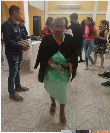
Kuvissa Raamattujen jakoa Venezuelassa